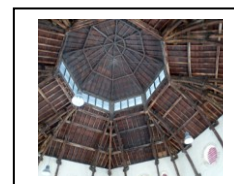
Charpente de la halle

Après une courte halte à la fontaine miraculeuse puis à la halle aux grains, la visite de la cathédrale magnifiquement restaurée nous a appris que sur un orgue accordé en baroque on ne pouvait pas jouer la marche nuptiale ! Les mélomanes auront apprécié... ou souri.